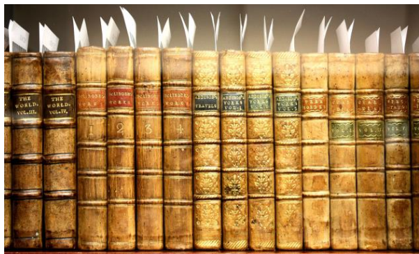
Yksityiskohta lukuisista kirjahyllyistä Detaljbild från en av de otaliga bokhyllorna

Ett tjugotal av Esbo Bokbindares medlemmar deltog i Nationalbibliotekets rundvandring under Mika Hakkarainens ledning, som berättade om husets historia, bibliotekets uppgifter och mångsidiga samlingar.